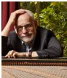
TON KOOPMAN ORGANO

È certamente l'artista mondialmente riconosciuto come il più grande interprete oggi esistente per il repertorio antico e segnatamente barocco. Innumerevoli le sue incisioni discografiche, le produzioni televisive, i video con oltre 400 CD e LP per Erato, Teldec, Sony, Deutsche Grammophon e Philips con l'integrale delle opere per organo e delle Cantate di J. S. Bach e di D. Buxtehude.